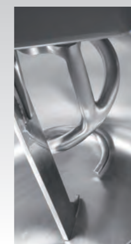
■ Pétrin à bras plongeurs IBT