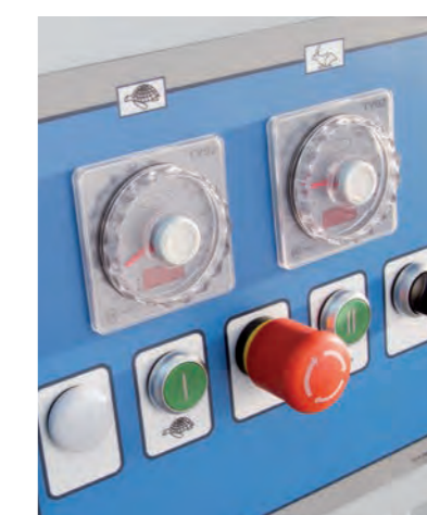
■ Pétrin à axe oblique AO