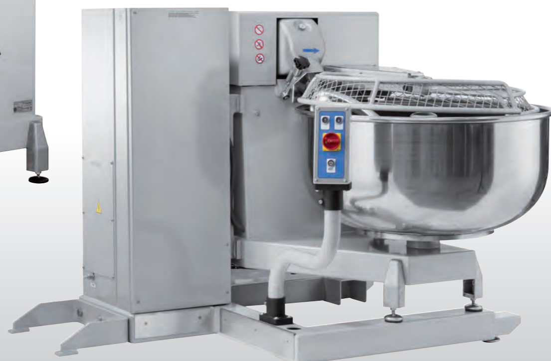
■ Pétrin auto-basculant à axe oblique AO RB/AO RS