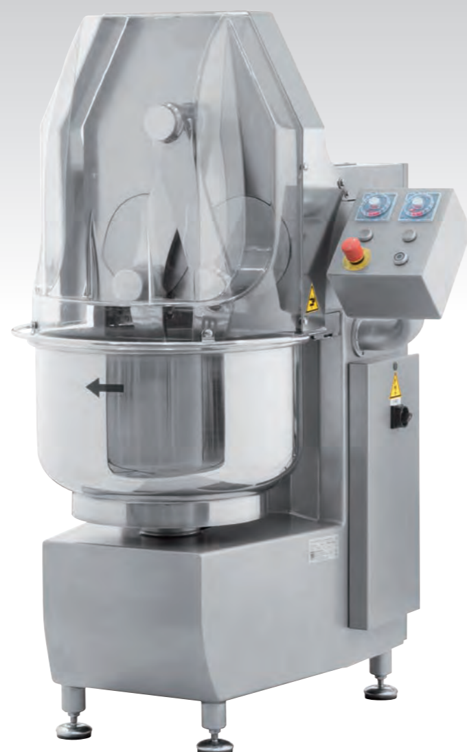
■ Pétrin à bras plongeurs IBT