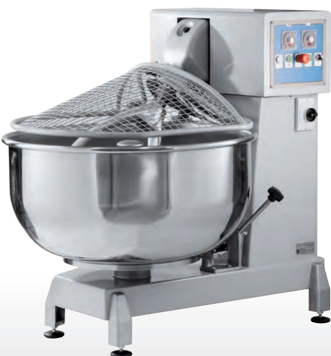
■ Pétrin à axe oblique AO