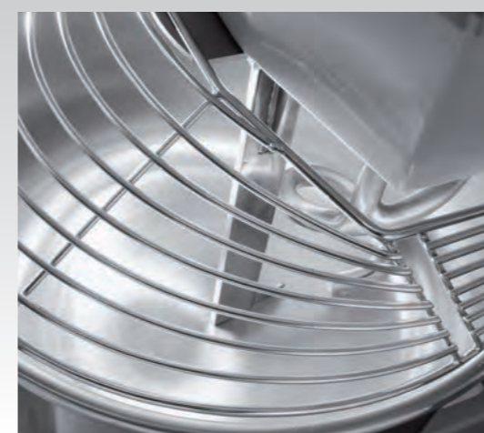
■ Pétrin à spirale ASM EVO