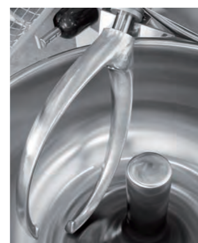
■ Pétrin à axe oblique AO