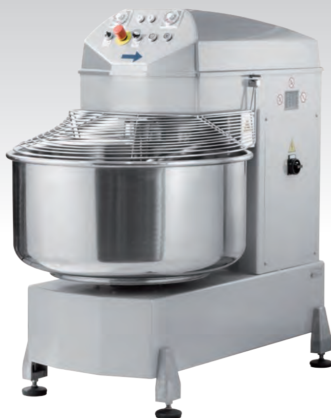
■ Pétrin à spirale ASM EVO